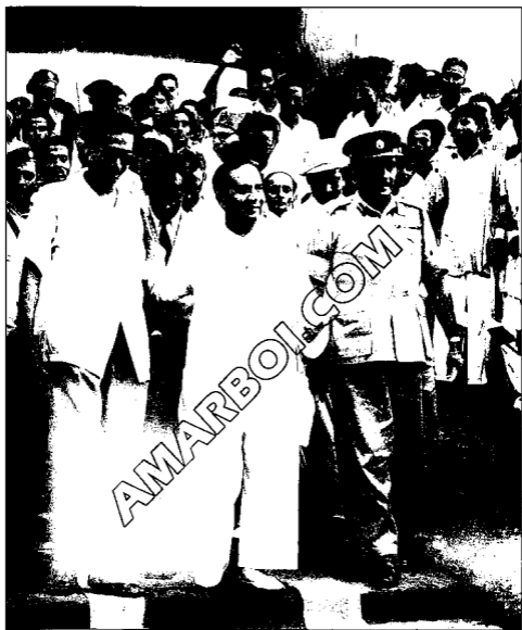
রাজশাহী সফরে হোসেন শহীদ সোহরাওয়ার্দীর সঙ্গে, ১৯৫৪