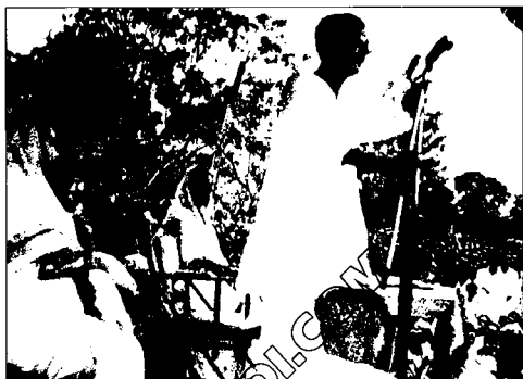
আরমানীটোল্লা মেয়দানে জনসভা, মে ১৯৫৩