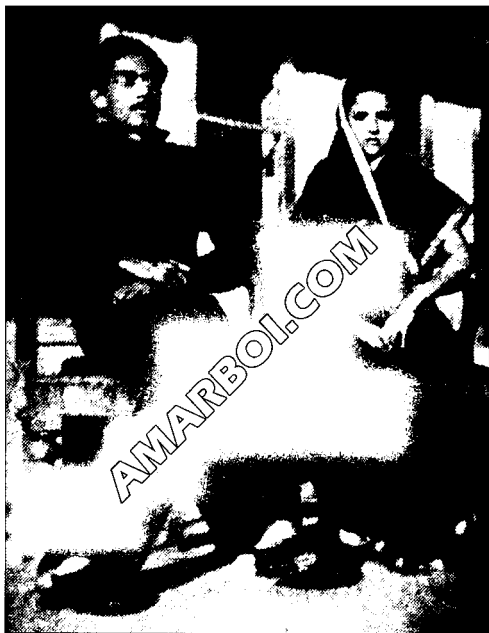
স্ট্রী বেগম ফজিলাতুননেছার সঙ্গে, ১৯৪৭