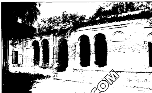
টুঙ্গিপাড়ায় আদিবেঙ্গলি বাড়ি