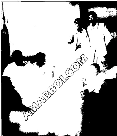
মহাত্মা গান্ধী ও হোসেন শহীদ সোহরাওয়ার্দীর সাথে লেখক (দভায়মান), ১৯৪৭