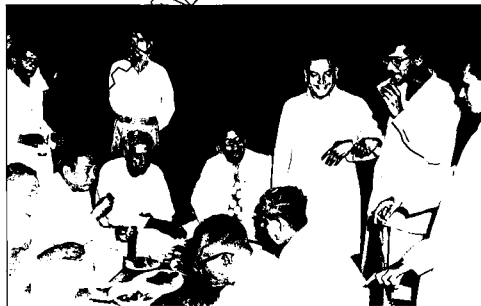
যুক্তফ্রন্টের নির্বাচন প্রাক্কালে শ্রার্থী মনোনয়ন বৈঠক, ডিসেম্বর ১৯৫৩