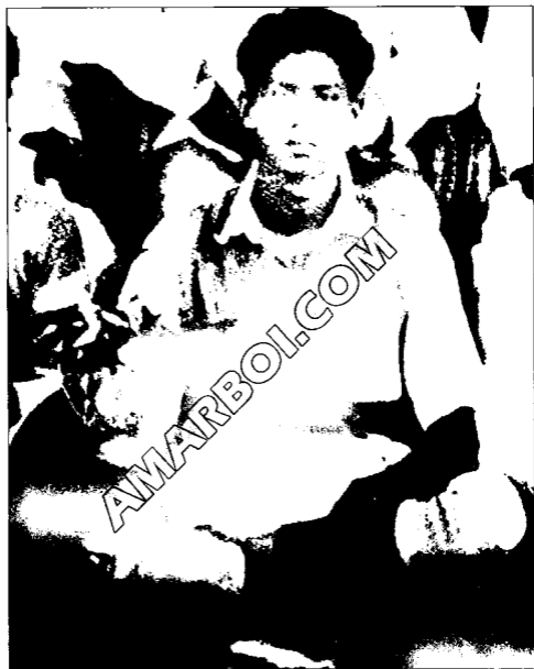
ফুটবল জার্সি পরিহিত লেখক, ১৯৪০