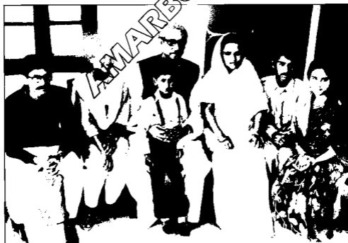
সপরিবারে লেখক। বামে স্ত্রী বেগম ফজিলাতুননেছা, শেখ জামাল ও শেখ হাসিনা। ডানে শেখ রেহানা, শেখ কামাল ও কোলে শেখ রাসেল, ১৯৭২