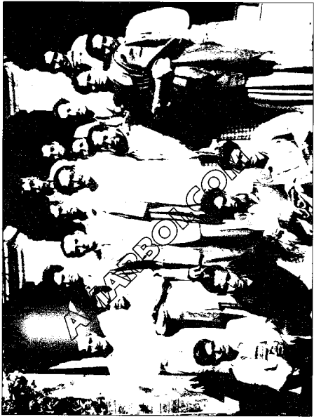
আওয়ামী লীগের নেতা-কর্মীদের সাথে, ১৯৫২