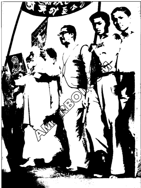
মওলানা ভাসানীসহ প্রভাতফেরিতে, ২১ ফেব্রুয়ারি ১৯৫৩