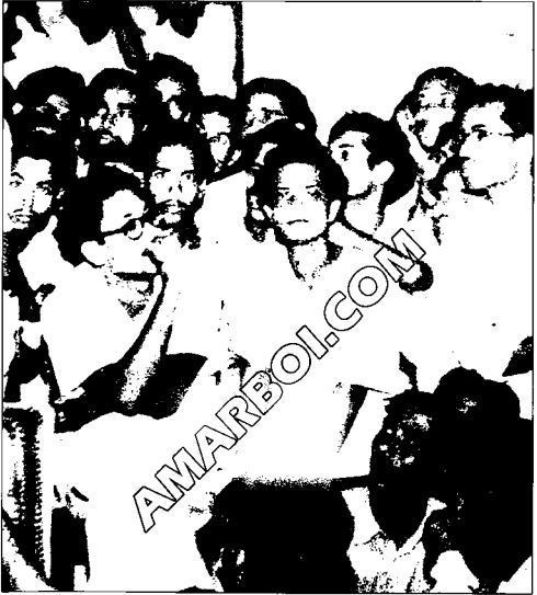
সহযোদ্ধাদের সঙ্গে পরামর্শকালে